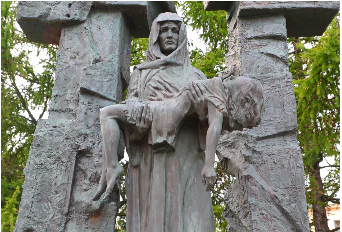
Памятник «Детям Беслана» в г. Санкт-Петербург

4. В российской столице ежегодно проходит акция «Дети Москвы против террора». У памятника «В память о жертвах трагедии в Беслане» проводится выставка детских рисунков против террора, дети читают стихи и исполняют тематические музыкальные произведения.