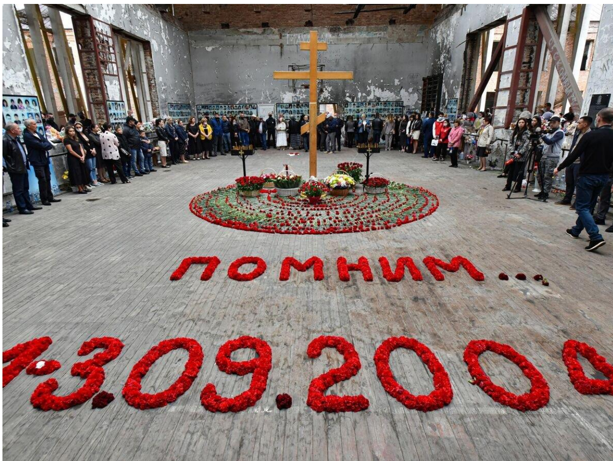
Акция памяти в стенах школы № 1 в г. Беслан

Ежегодно 3 сентября жители России отдают дань памяти тысячам соотечественников, погибшим от рук террористов: в Беслане, в театральном центре на Дубровке, в Буденновске, Первомайском, при взрывах жилых домов в Москве, Буйнакске и Волгодонске, в других террористических актах, а также отдают дань уважения сотрудникам силовых структур, погибшим при предотвращении терактов и спасении заложников.