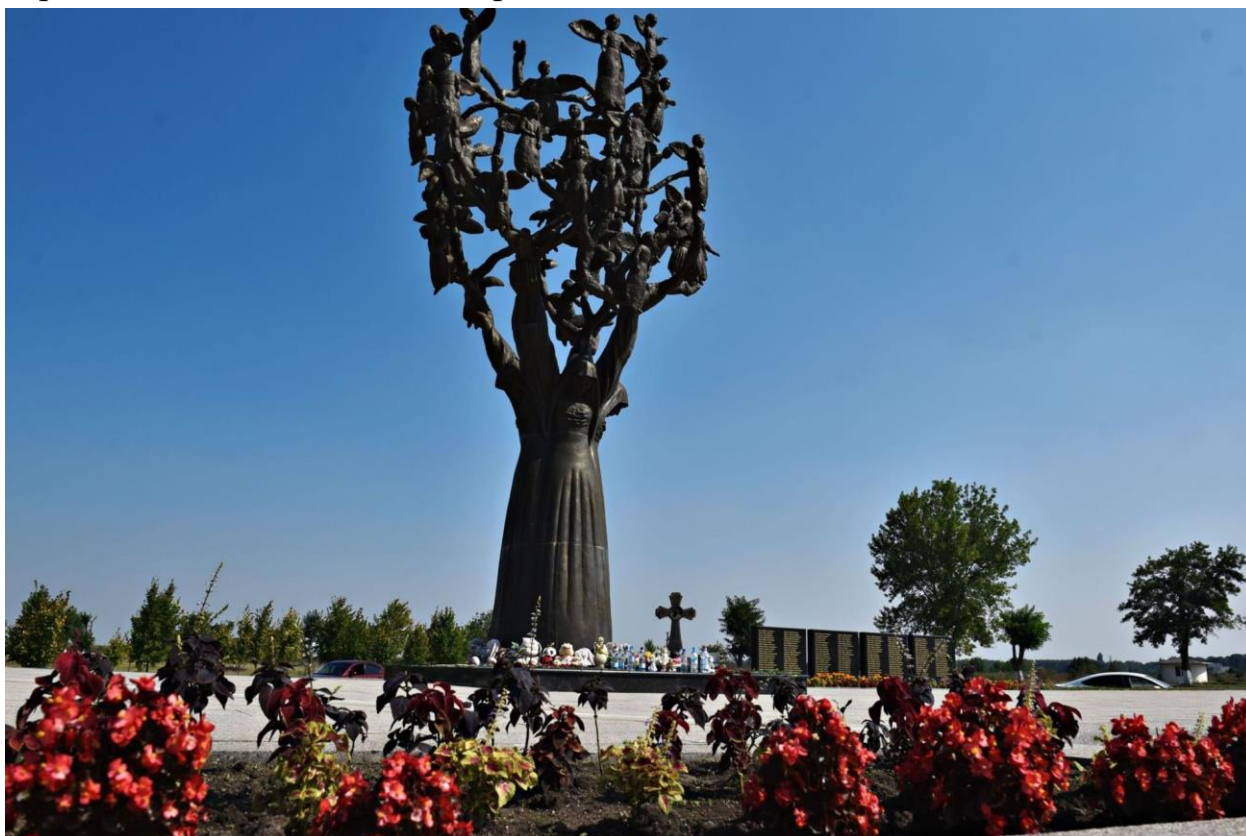
Памятник «Дерево скорби» на мемориальном кладбище «Город ангелов» в г. Беслан

1. В пять минут второго по московскому времени в разрушенной бесланской школе раздаётся удар колокола и объявляется минута молчания. Именно в это время в 2004 году раздался первый взрыв. В этот же момент на территории всей республики Северная Осетия прерывают работу государственные учреждения, останавливается общественный транспорт, а имена погибших произносят на мемориальном кладбище «Город ангелов» в городе Беслане под отсчёт метронома.