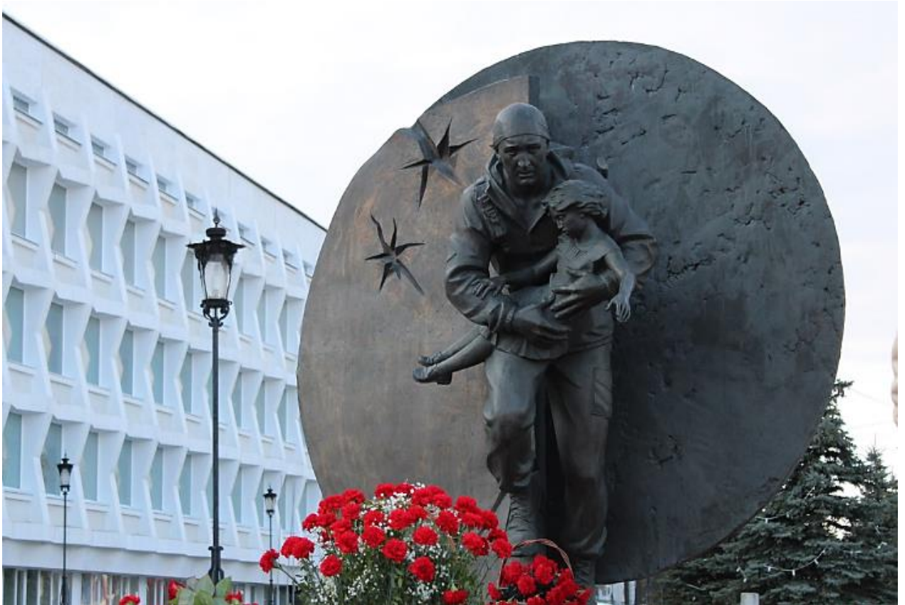
Памятник Дмитрию Разумовскому, погибшему при освобождении заложников во время теракта в Беслане

3. Ещё один монумент, связанный с трагическими событиями «Детям Беслана». Он появился 28 августа 2008 г. в Санкт-Петербурге, неподалёку от храма Успения Пресвятой Богородицы. Во время его открытия в постамент была вмурована капсула с землёй, взятой с территории школы № 1 города Беслана, также к памятнику прикрепили специальную пластину с поэтическим посланием бесланского школьника. Здесь ежегодно проводятся акции в память о погибших во время теракта в г. Беслан.